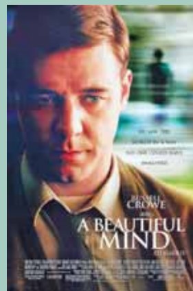
بیک ذهن زیبا / کارگردان ران هاوارد / ۲۰۰۱

بازی درخشان راسل کرو و تقلید دقیق رفتار جان نش در این فیلم، از جمله نقاط مثبت یک ذهن زیبا به حساب می‌آید.