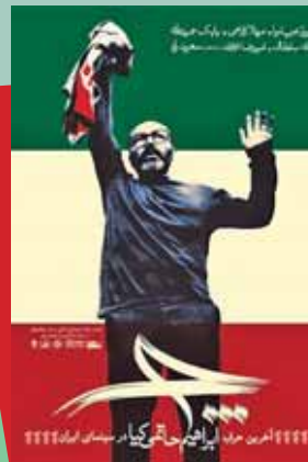
چ / کارگردان ابراهیم حاتمی‌کیا / ۱۳۹۴

«چ» یکی از معروفترین فیلم‌های ایرانی در «ژانر زندگی‌نامه‌ای»، به کارگردانی ابراهیم حاتمی‌کیا است. این فیلم محصول سال ۱۳۹۲ است و ۴۸ ساعت از زندگی شهید مصطفی چمران را حکایت می‌کند.